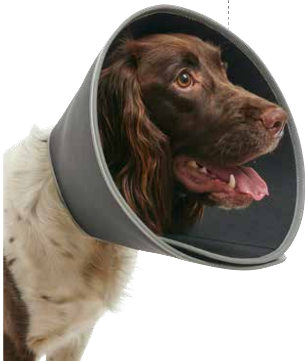
BUSTER Foam krave